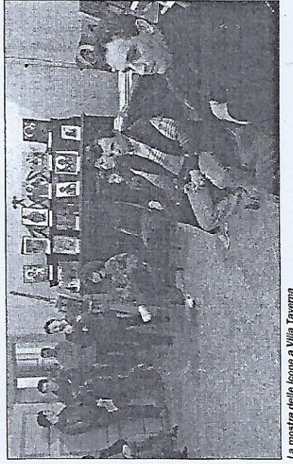
La mostra delle icone a Villa Taverna