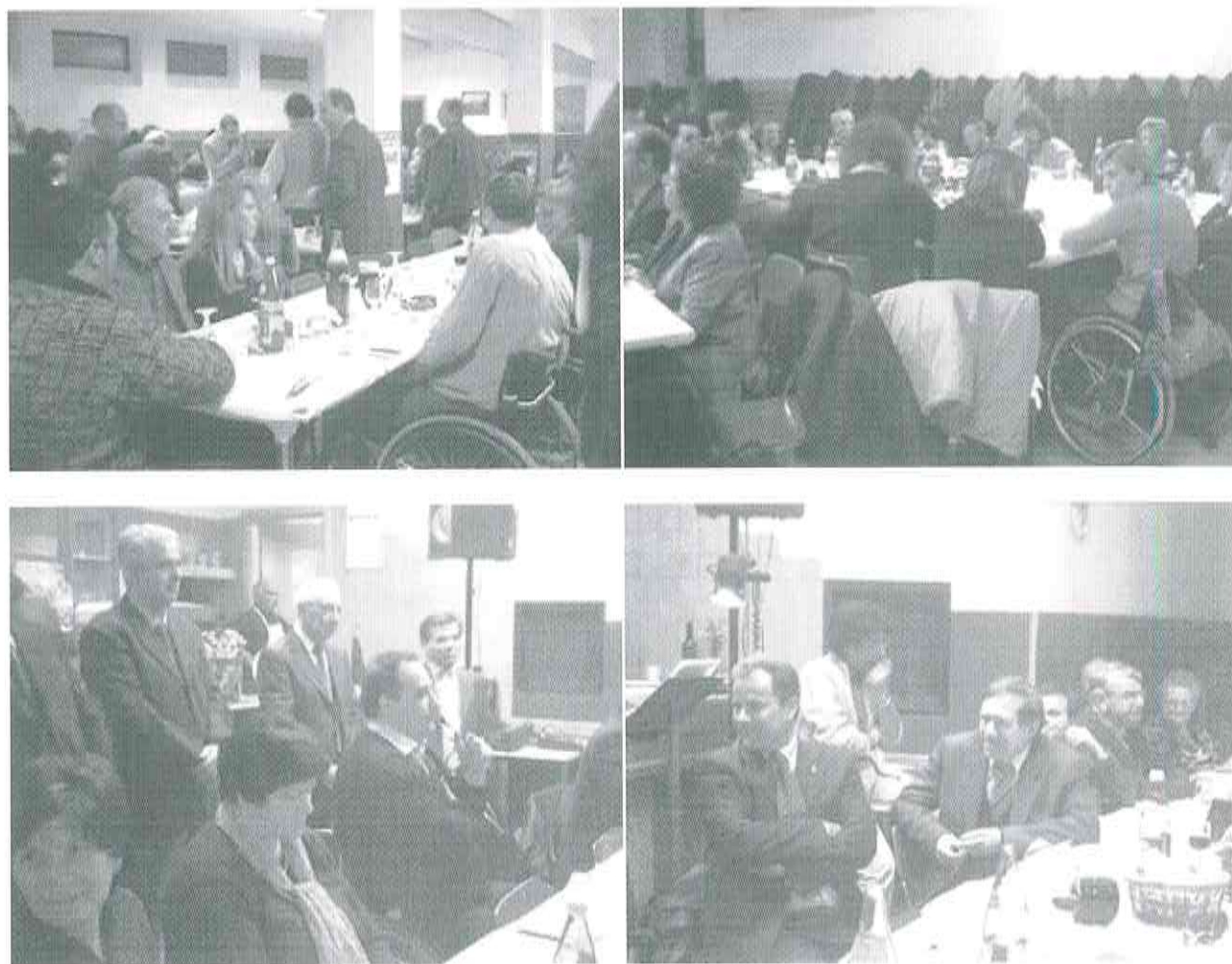
Alcuni momenti della cena

Angelo Colombo ha concluso il ciclo di interventi, ricordando l'attività svolta dal gruppo per la ricerca sulle lesioni del midollo spinale e ringraziando i presenti, dalle associazioni alle amministrazioni. Un uomo forte, un testimone internazionale della battaglia contro la difficoltà e la fatica della vita. Una figura riconosciuta dalle maggiori autorità mondiali, dal Papa Giovanni Paolo II al premio Nobel Rita Levi Montalcini, al Presidente della Repubblica Carlo Azeglio Ciampi. A chiudere la sera, una piccola lotteria organizzata dall'associazione per avvicinare ulteriormente i presenti alla lotta che quotidianamente cerca di portare avanti.